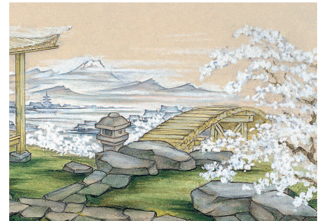
Emil Preetorius, Bühnenbild: Madame Butterfly, Deutsches Theatermuseum